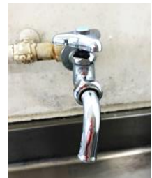
蛇口もピカピカに